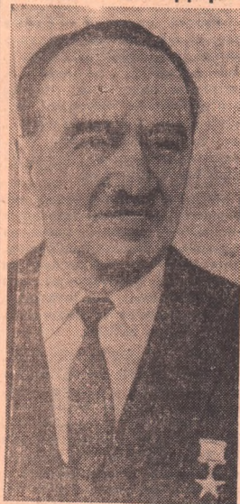
25 ноября исполняется 75 лет со дня рождения (1895) видного деятеля Коммунистической партии и Советского государства Анастаса Ивановича Микояна.