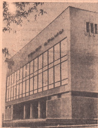
НА СНИМКЕ: Орский театр драмы имени А. С. Пушкина.