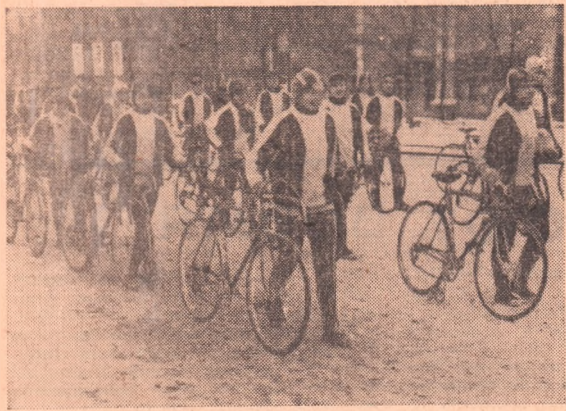
В праздничной колонне демонстрантов идут учащиеся Орского музыкального училища и велосипедисты спортивного клуба «Южный Урал».

Гедатор—3.04.72, зам. редактора, стел партийной жизни, фотокорреспондент—3.04.73, отдел промышленности и отдел культуры и быта—3.03.47, отдел писем. бухгалтерия—3.03.45, ответственный секретарь—3.03.80. АДРЕС РЕДАКЦИИ: УЛ. СОВЕТСКАЯ, 84.