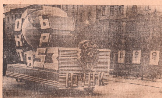
Праздничная демонстрация трудящихся Орска.