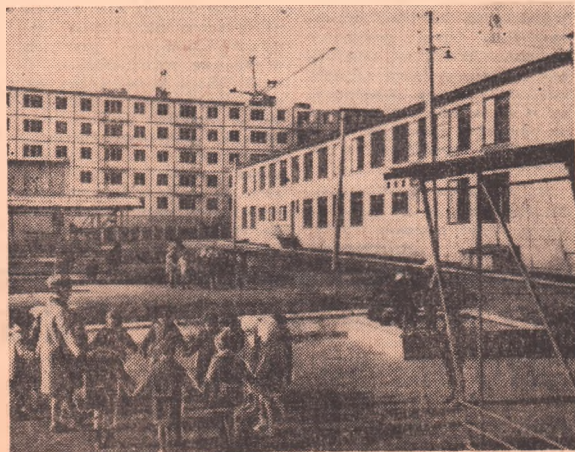
НА СНИМКЕ: новый детсад № 83 на улице Медногорской.

В. КРЮК, старший инструктор горродского комитета по физкультуре и спорту.