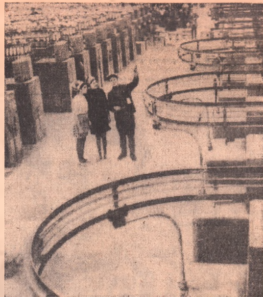
В Оренбурге строится крупнейший на Урале шелкоткацкий комбинат. Работает его первая очередь — крупное производство.

Встан на трудовую вахту в честь XXIV съезда КПСС, монтажники стремятся раньше срока сдать в эксплуатацию вторую очередь. Ежегодно на новом комбинате будут изготавливать 53 миллиона метров ткани.