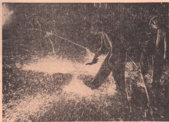
Мартеновский цех № 16 Южуралмашзавода. Взята последняя проба. До выпуска металла остались считанные минуты...