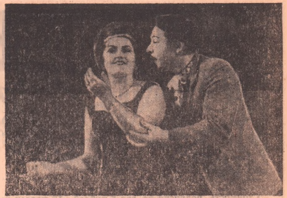
НА СНИМКЕ: сцена из оперетты «Поцелуй Чаниты».