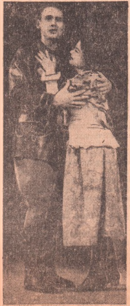
НА СНИМКАХ: сцены из оперетт «Поручик Лавровский» и «Вольный ветер».

После капитального ремонта широко распахнулись двери Дома культуры нефтяников, снова забурлила здесь бодрящая жизнь, продолжается творческая работа самодеятельных артистов. О буднях этого очага культуры мы и рассказываем сегодня.