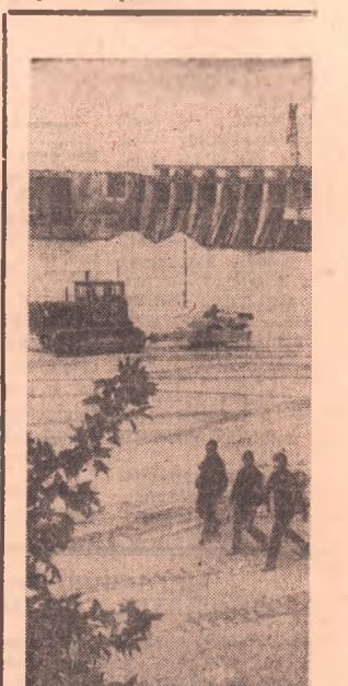
ЗАПОРЖЬЕ. Как уже сообщалось, рядом с Днепропрорской гидроэлектростанцией имени В. И. Ленина сооружается «Днепрогэс-2». Когда она войдет в строй, общая мощность Днепрогэса превысит миллион 400 тысяч киловатт. Сейчас в районе строительства ведется насыпка вешка, щебня и камня в перемычку котлована, сооружаются автомобильные дороги.

Кроме того, напечатана разнообразная информация «Оренбургские новости», «Гвоздь жизни», «Голос мая», фильмы ноябрьского акрана и другие.