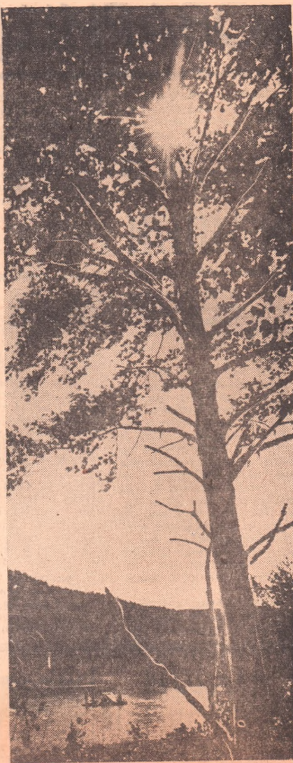
спортивный клуб «Южный Урал».

Большую помощь в организации и проведении похода нам оказал завод ком профсоюза Южурал-машзавода и