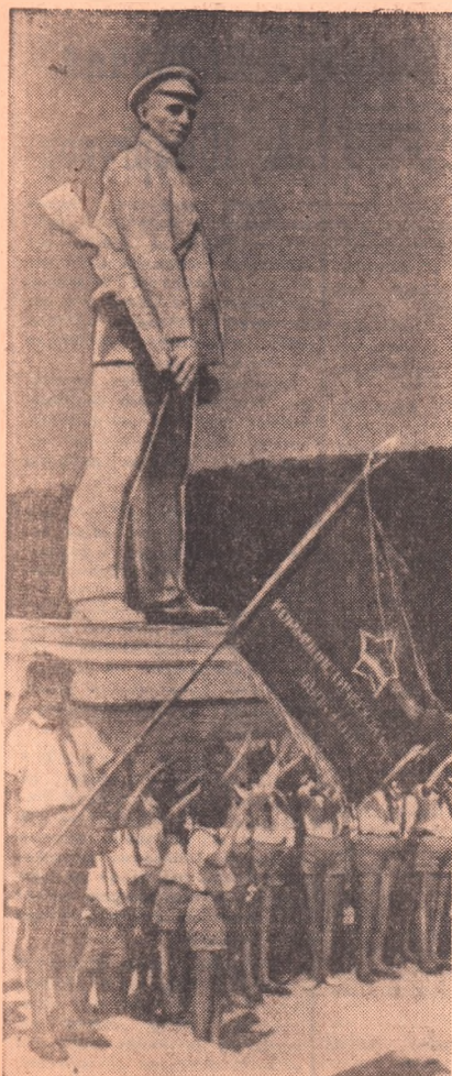
Недалеко от города Анапы, на обрывистом берегу моря возвышается мемориальный памятник моряку-черноморцу, Герою Советского Союза Дмитрию Семеновичу Калинин, погибшему в мае 1943 года. Ежедневно к памятнику приходят на экскурсию группы отдыхающих и пионеров.