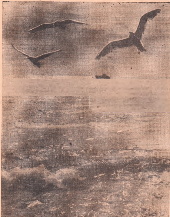
Самое сильное в мире — Черное море мое...

Приглашаются партийные, профсоюзные и хозяйственные руководители предприятий и строек, главные инженеры, начальники цехов, служб и отделов, экономисты и плавовики. Начало в 3 часа дня.