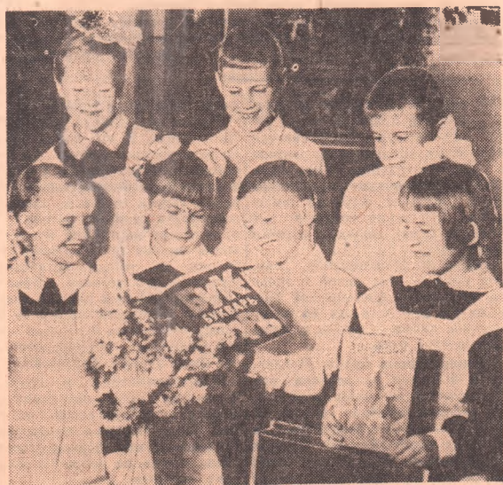
НА СНИМКЕ группа воспитанников детского сада № 22. Сегодня они вместе со сверстниками сядут за парты.