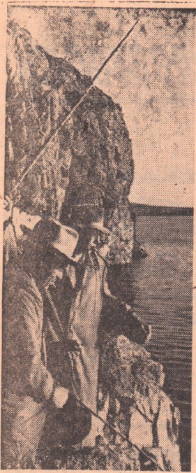
Иртышское взморье привлекает массу туристов, охотников, любителей-рыболовов. Сейчас, в летнюю пору, из Орска, Новотроицка, Гая и других районов в свободное от работы время сюда съезжаются сотни людей, чтобы отдохнуть на берегу огромного водоема, подышать чудесным иртышским воздухом. НА СНИМКЕ: Любитель-рыболовы на Иртышском взморье.