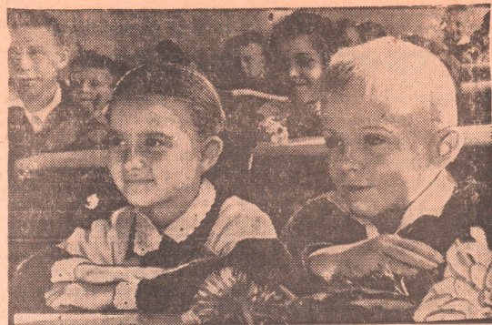
Более 180 детей никельщиков первый раз в жизни переступили порог школы № 16. Теплой и радостной была встреча, которую организовали учителя и старше школьники первого сентября. Посмотрите, как веселы лица ребят. Им все здесь нравится.