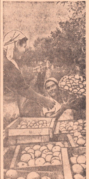
Фото и текст Б. ТАНА.

Согнувшиеся под тяжестью плодов стоят яблоки. А рядом — совсем молодые деревья. Они посажены прошлой осенью. Почти 12 гектаров нового сада сумели заложить труженики совхоза. Сейчас идет тщательное наблюдение за ростом и развитием молодых питомцев. Ведь уже вскоре и этот участок даст богатый урожай.