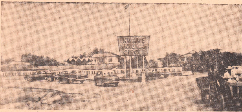
Республика Гана, Площадь имени Кваме Нкрума в Аккре. Фото М. Редькина