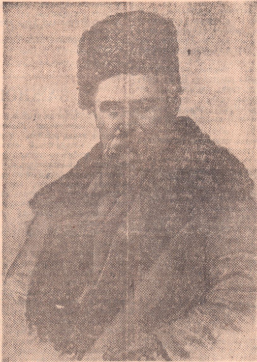
Тарас Григорьевич Шевченко