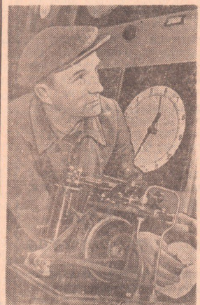
«Лучший рационализатор Ленинграда»

Если раньше ожидание разговора с Оренбургом занимало нередко час, а то и больше, то теперь, приняв ваш заказ, работница связи предупреждает: