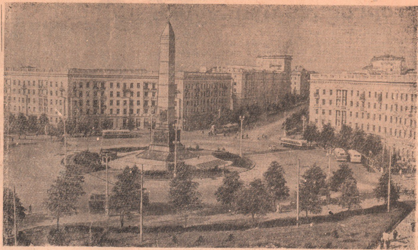
Минск. Круглая площадь. В центре — памятник советским воинам и партизанам.

Такой же доклад был поставлен на семинаре агитаторов, который проходил в Доме культуры нефтяников. Здесь, кроме того, была прочитана лекция о перспективах развития Оренбургской области и нашего города.