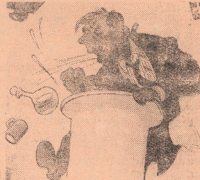
Мастер антихудожественного слова.

Лыков. — Выпьем за здоровье патриотов, работающих на целине!