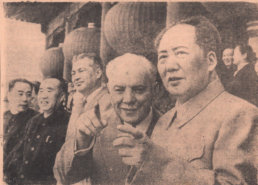
Празднование Первого мая в столице Китайской Народной Республики — Пекине. На снимке: на правительственной трибуне. Справа налево — Мао Цзэ-дун, К. Е. Ворошилов, Ш. Р. Рашидов, Чжу Дэ, Чжоу Энь-лай.