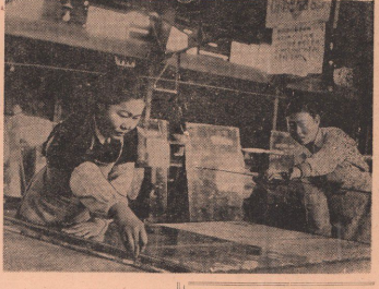
Крепкая Народно-Демократическая Республика Венгрии оказывает братскую помощь венгерскому народу. В Будапеште отправляется большое количество строительных материалов.

На снимке: в одном из цехов сталового завода в Орле. Подготовке стекла к отправке в Венгрии.