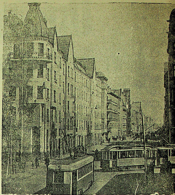
Столица Латвийской ССР — Рига. На снимке: улица Суворова.

В сплоченной братской семье советских народов во главе с великим русским народом, под непобедимым знаменем Ленина — Сталина трудящиеся Литвы, Латвии и Эстонии идут вперед по пути коммунизма. Десятилетний юбилей советских республик Прибалтики — знаменательная дата на этом славном пути. Отмечая ее, трудящиеся Литовской, Латвийской и Эстонской Советских Социалистических Республик обращаются со словами глубокой любви и благодарности к своему лучшему другу, организатору всех побед советского народа, великому вождю и учителю Иосифу Виссарионовичу Сталину.