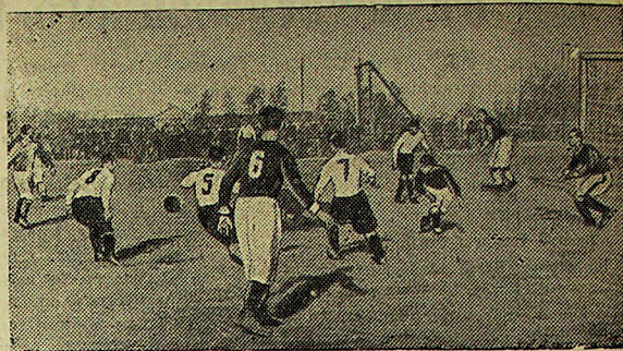
Чемпион города по футболу — команда «Цветмет» позавчера принимала на своем поле футболистов спортивного общества «Локомотив». Первый матч на кубок города по футболу металлурги провели с большим подъемом и выиграли встречу со счетом 6:2. На снимке: момент игры у ворот «Локомотива».