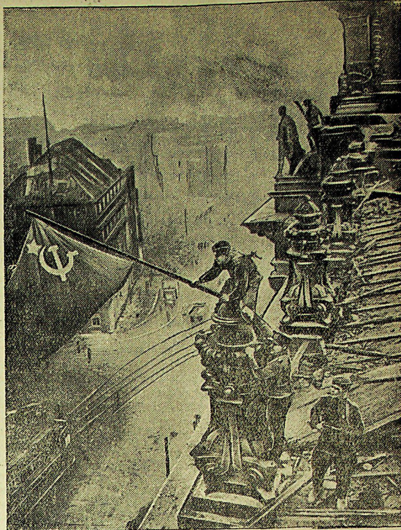
2 мая 1945 года части Советской Армии полностью овладели столицей Германии — Берлином.

На сцене: воздвигли знамя Победы над германским рейхстагом в Берлине.