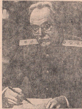
Артист Б. Чирков в роли академика Верейского.

Вот эта мысль и легла в основу нового художественного фильма «Суд чести» — яркого и страстного кинопроизведения о советском патриотизме, о борьбе советских ученых за честь отечественной науки, за ее приоритет. С большой силой разоблачается в нем реакционная американская наука и отвратительные черты низкопоклонства перед нею со стороны некоторых недалеких людей, не выходящих далее своего кабинета, своей личной «славы».