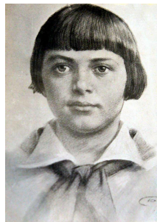
Зина Портнова (20 февраля 1926 – 10 января 1944)