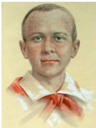
Марат Казей (10 октября 1929 – 11 мая 1944)