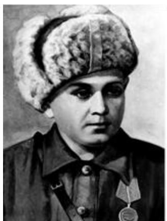
Леня Голиков (17 июня 1926 – 24 января 1943)