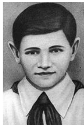
Валя Котик (11 февраля 1930 – 17 февраля 1944)