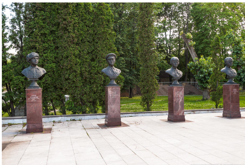
Скульптурный ансамбль «Пионеры-герои». Дата постройки: 1960 г. Скульптор Н. Конгисер. Москва. ВДНХ

За последние полвека обстоятельства подвигов четверки героев стали известны всей стране: на их примере выросло не одно поколение советских школьников.